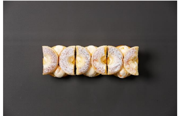
Recheio de natas e tangerina