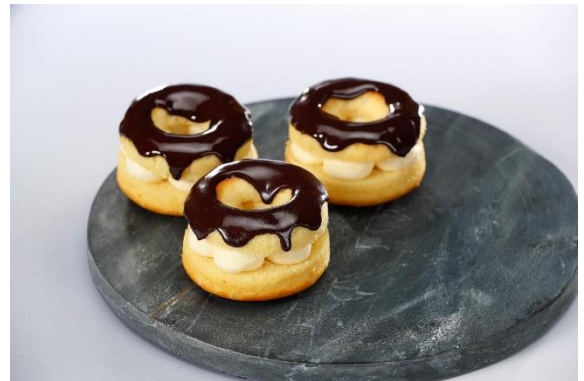
Creme de vinho branco