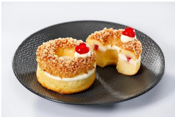
Recheio de creme e crocante de avelã