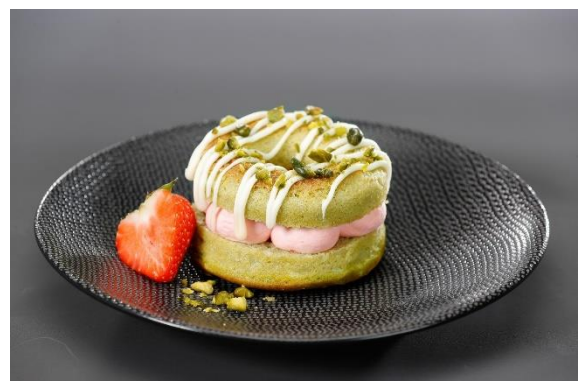
De pistácio com recheio de morango