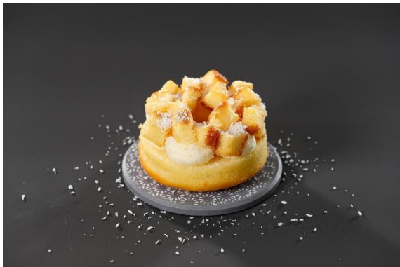
Creme de baunilha e coco