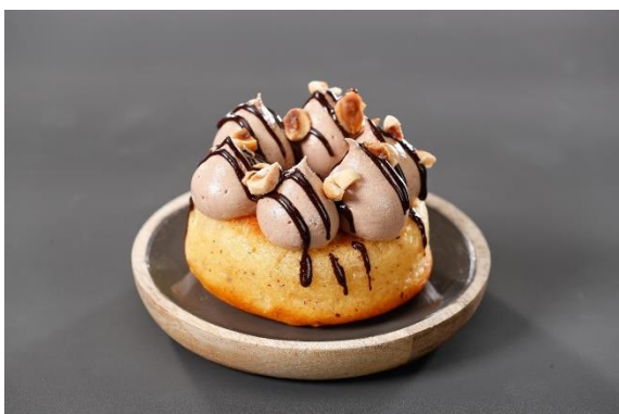
Creme de chocolate e avelãs